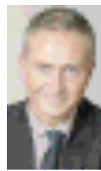
FIRMATARIO Angelo Miglietta è il segretario generale della Fondazione Crt